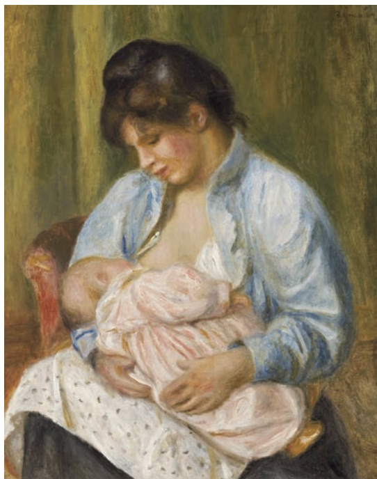
ルノワール「母と子」1894年 (スコットランド国立美術館 所蔵)

てそれを育む場は、最も身近な家庭です。親に真心を向ける時に敬愛となり、子供に向ける時は慈愛に、そして夫婦の関係では信愛へと転じます。そして親子間の上下、夫婦間の左右の愛は、友愛、師弟愛、隣人愛へと発するなど、距離的な広がりをも見せるのです。